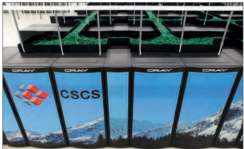
Die meisten der Top-Supercomputer der Welt nutzen Linux-basierte Betriebssysteme. So auch der abgebildete Piz Daint der ETH Zürich im Swiss National Supercomputing Centre.

Red Hat Enterprise Linux (RHEL) und dessen Derivate: Hinter RHEL steckt eines der wohl grössten Unternehmen im Linux-Bereich, namentlich Red Hat, welches wiederum IBM gehört. Red Hat ist ein kommerzielles Linux, wurde für Unternehmen entwickelt und wird hauptsächlich im Server- und Workstation-Bereich verwendet. RHEL basiert auf Fedora und dessen Versionierung. Für RHEL gibt es je nach Einsatz unterschiedliche SLA und Support Subscriptions, die gelöst werden können. Seit anfangs 2021 ist das wohl bekannteste RHEL Derivat, CentOS Linux, nicht mehr als eigenes Linux (Downstream) verfügbar und wurde als Rolling Release (Upstream) in den Entwicklungsprozess von RHEL integriert. Mit dieser Änderung erhalten Unternehmen, die über einen Red Hat Account verfügen bis zu 16 kostenlose RHEL-Lizenzen ohne Support. Ohne eine aktive Subscription für RHEL